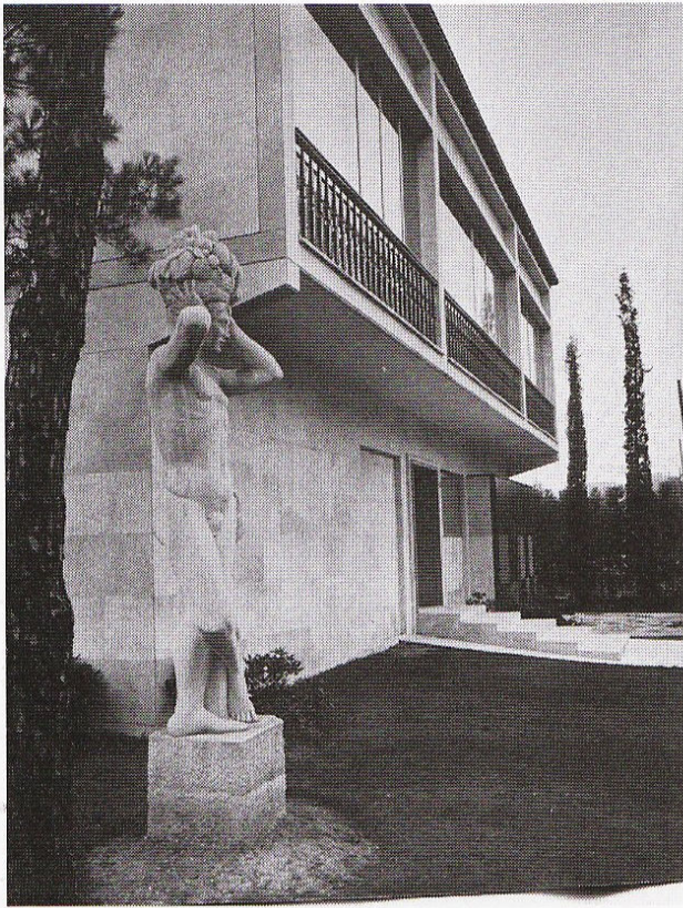
Bergamo, Casa Trussardi, 1940.